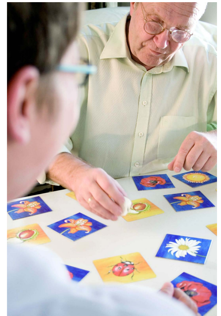
Gemeinsam statt einsam: Bei den Maltesern ist immer etwas los! Die Helferinnen und Helfer arbeiten kreativ und verständnisvoll.

Beim Klön-Mittagstisch der Warendorfer Malteser schließlich können einsame, benachteiligte Menschen in netter Atmosphäre und Gemeinschaft alle zwei Wochen gemeinsam essen; auch dies bedeutet konkret mehr Lebensqualität für ältere Menschen und beugt Vereinsamung vor.